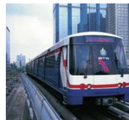
Skytrain i Bangkok.

Du kan se de flesta djur som finns vilda i Thailand här, även vilda elefanter. Där finns också stora områden med orörd regnskog och annat som får en att känna sig som en upptäcktsresande på 1800-talet.