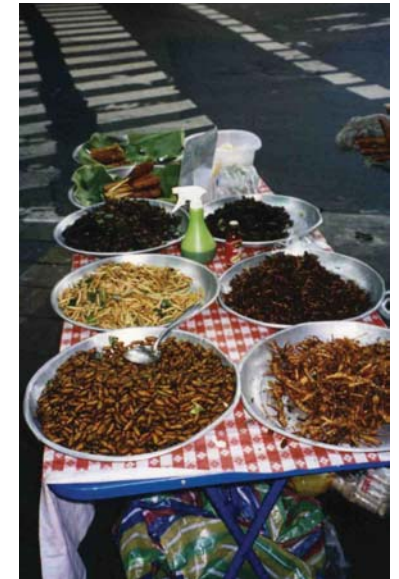
Thailändska snacks: skalbaggar, gräshoppor, larver.

När servitören/servitrisen frågar dig arroy ? Kan du svara arroy mak-mak om du tyckte maten var god.