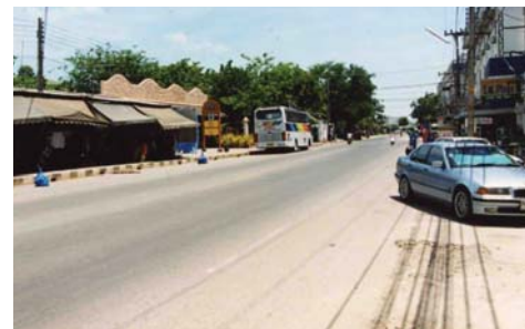
Huvudgatan i Ban Phe.

Nackdelen är att du luktar som en surströmmingsfestival efteråt.