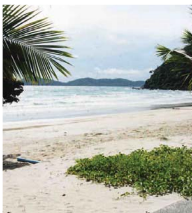
Ao Phrao Beach.

Ao Kiu och Ao Wai är stränderna du ska söka dig till om du vill ha den där "Robinsonkän-