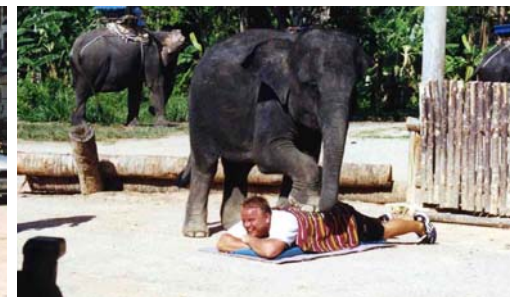
Traditionell (?) thailändsk massage.