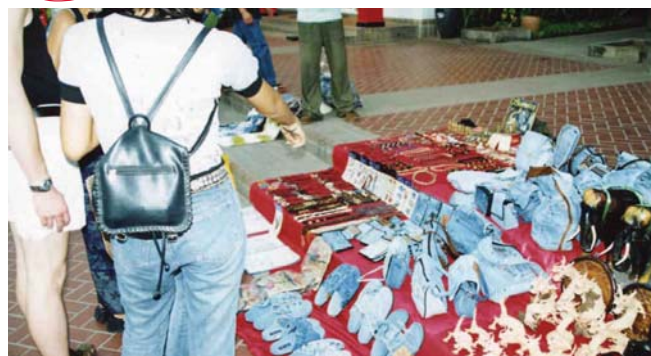
Gatuhandel i Pattaya: tofflor, handväskor, rygsäckar, plånböcker – allting tillverkat av gamla jeans.