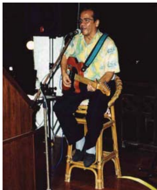
Underhållning på Ao Prao Resort.

Till Hat Sai Kaew, Ao Phutsa eller Ao Phai kan man lätt gå.