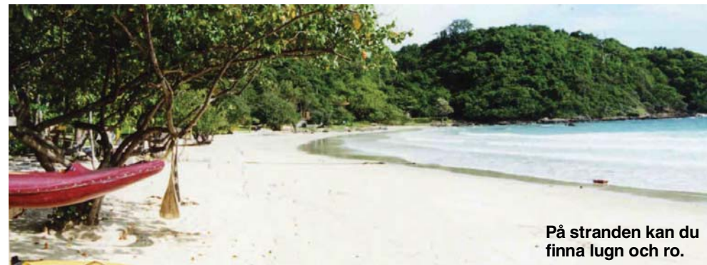
På stranden kan du finna lugn och ro.