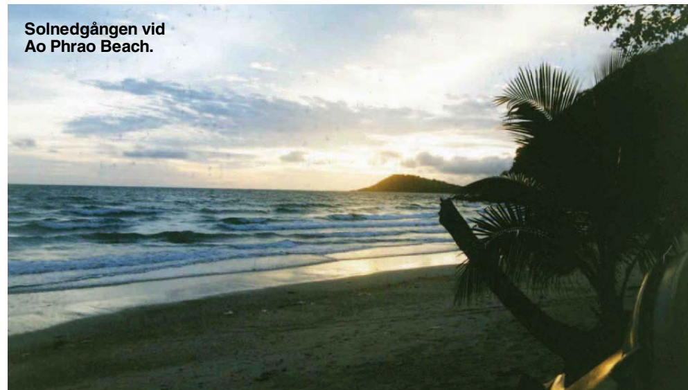
Solnedgången vid Ao Phrao Beach.