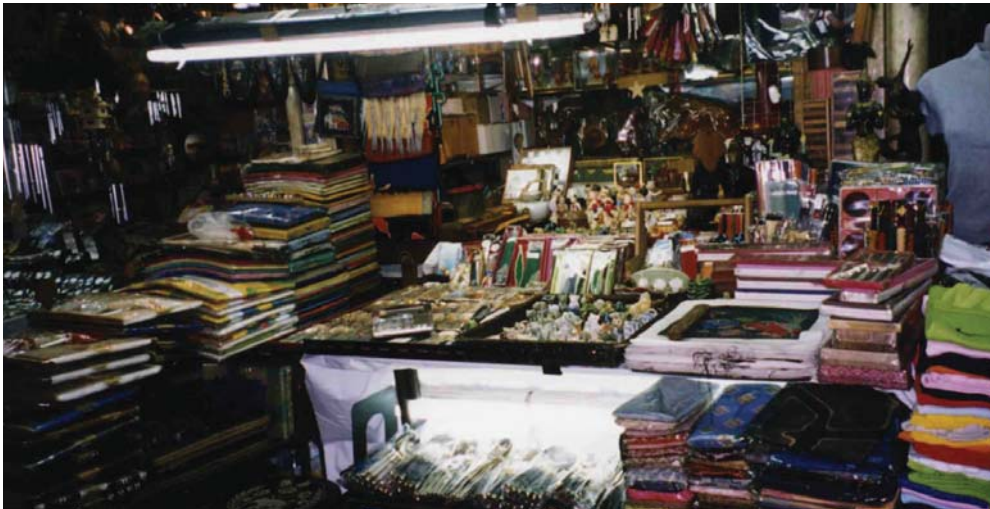
Allt finns att köpa längs gatorna.