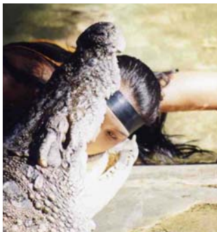
På zoo kan du kyssa en krokodil.

Pattaya Palladium är ett nöjeskomplex i de norra delarna av staden som bland annat innehåller ett disco med kapacitet för drygt