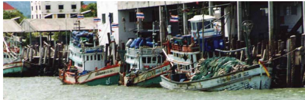
Fullastade fiskebåtar i Ban Phe, strax öster om Rayong.