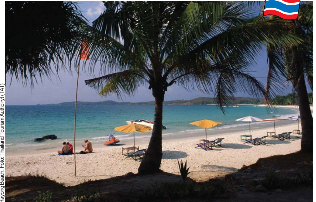
Rayong Beach.