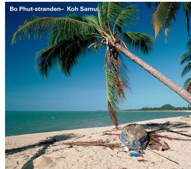
Phi är partyprissarnas.

Krabi stad har ingen strand utan funkar som utgångspunkt för stränder som Ao Nang , Ao Rai-ley , Ko Lanta och Ko Phi Phi . Ao Nang är chartrig, Ao Phra Nang nära Rai-ley har utsetts till världens näst vackraste strand – och nog är den spektakulär. Ko Lanta är barnfamiljernas ö och Ko Phi