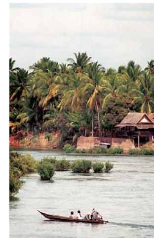
Mekhongfloden i Laos.

Får du nog av turismen i Thailand? Åk till Laos. "Som Thailand för 10 år sedan" säger många. Räkna dock med långa slingriga bussresor. Alternativet till bussen är att färdas i båt på Mekhongfloden.