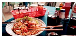
Enkelt men fantastiskt gott.

Tom yam är thaisoppa med stort S, den ger dig domnade läppar och svettattacker. Oftast med räkor, då heter den tom yam kung. Tom ka är en mildare kokos- och limesoppa som oftast innehåller kyckling, tom ka gai.