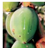
God att dricka.

Hittar du överallt, se upp så att du inte får en i huvudet... Den är helt grön när den färsk och innehåller då mer mjölk än fruktösa. Den serveras hel med ett sugrör. Mycket läskande.