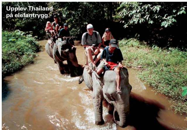
Upplev Thailand på elefantrygg.

Vilda elefanter, tigrar, pantrar, björnar, apor, skorpioner, ormar... det finns många spännande djur i Thailand. Tyvärr är de flesta utrotningshotade och svåra att få syn på. I nationalparkerna är chanserna bättre. Khao Yai nära Bangkok är en av de äldsta. På många går det att uppleva naturen på en elefantrygg.