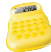
Knappa in ditt bud.

om de sista 10 bahten är bara giringt. Låt försäljaren få sista ordet, så behåller han ansiktet. Pruta inte heller på en vara om du inte är beredd att köpa den.