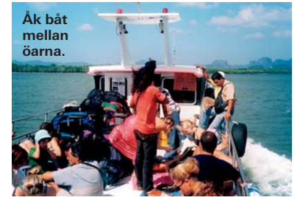
Åk båt mellan öarna.

Landsbygdens och öarnas taxi. Som en liten minibuss, fast av thailändskt stuk – du sitter på flaket på en pick-up-truck. Ofta också ett fast pris, som kan vara allt ifrån tokbilligt till snordyrt.