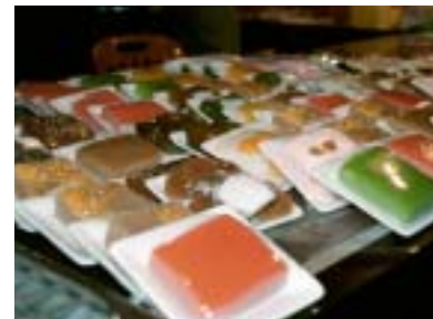
Ät thaigodis i stället för Mars. Här "sticky rice".

gaste alternativet med hjälp av hotellpersonal och tuk-tukförare