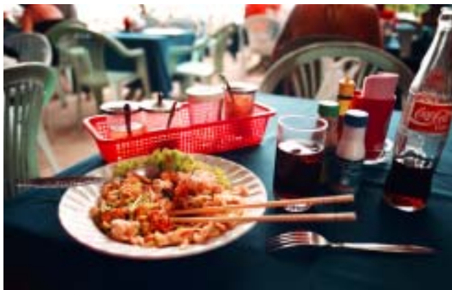
Det vimlar av bra och billiga restauranger - hitta ditt eget favoritställe.

Naturligtvis ska du prova färsk fisk, bläckfisk, krabba och hummer, till exempel på Saevoy Seafood i Patong.