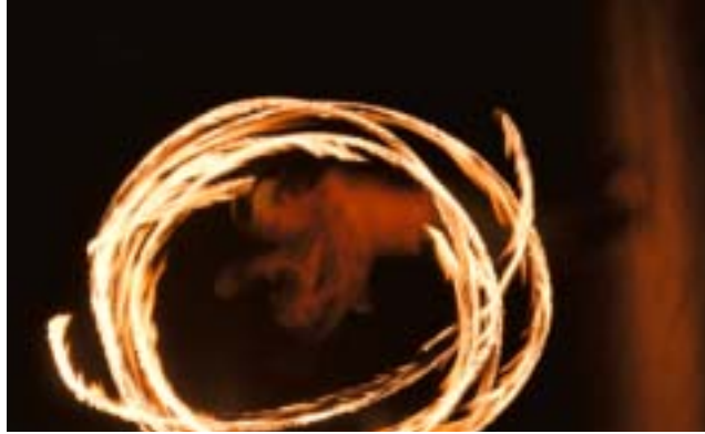
Firechains. Träna först – tänd på sen...

Gillade du filmen "Fight club" ska du absolut besöka en thaiboxningsarena en kväll. Om inte, stanna hemma.