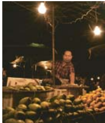
Vill du ha fruktshake? Gå till Pattong nattmarknad.

Europeiskt och importerat vin kostar ofta dubbelt mer än på systembolaget.