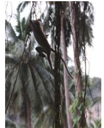
De vilda aporna är oftast snälla.

Finns alltid i närheten av koraller. Sätt inte ner foten! De är giftiga – och taggarna lever vidare och måste slås sönder inne i foten.