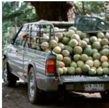
En bil kommer lastad. Med kokosnötter.