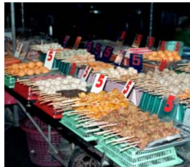
Maten på marknaden är både god och billig.