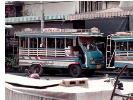
Billigare än tuk tuk - songthaew.

Färdmedlet inne i Phuket stad. Förarna har röd eller grön väst.