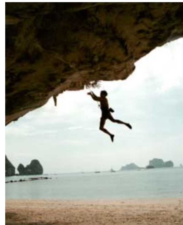
Absolut överhäng. Inget för nybörjaren.

En av världens absolut bästa klättringar erbjuds utanför Krabi vid stränderna Ton Sai och Railey beach. Hyr utrustning på plats, även nybörjarkurser.