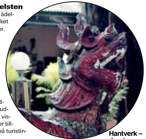
Hantverk – fyndarens bästa köp.

Görs i trä, metalltråd, keramik och porslin. Buddhafigurer är förbjudna att föra ut och vissa hantverk kräver tillstånd. Hör efter på turistinformation.