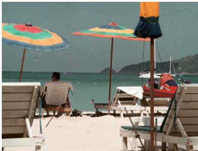
Patong Beach, vackert och välfyllt.

Nära flygplatsen och en bra plats att bo de första nätterna. 400 meter guldfärgad strand. Tre små hotell med restauranger,